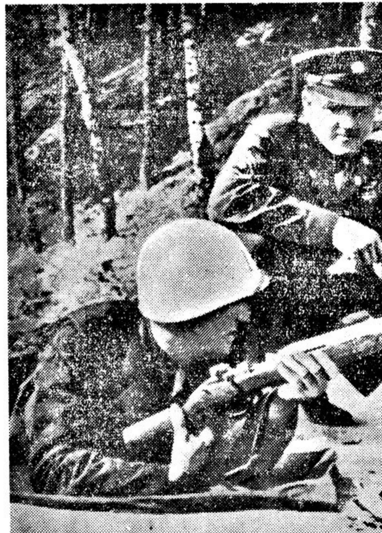
Американские поджигатели войны возрождают германский милитаризм, создают армию немецких наемников. Уже сейчас в Западной Германии существуют военные формирования, численность которых превышает 450 тысяч человек. На фото: американский наемник обучает немецкого наемника обращению с американским оружием.

«Народная мудрость гласит: «Бит похож на устро, корабельщики пристают к нему и, вбив колья, привязывают к ним корабли; чудовище не трогается, но как только разведут на его хребте огонь, он тотчас уходит в глубину, увлекая за собой обманутых пловцов». Эта печальная судьба ждет и американских поджигателей войны.