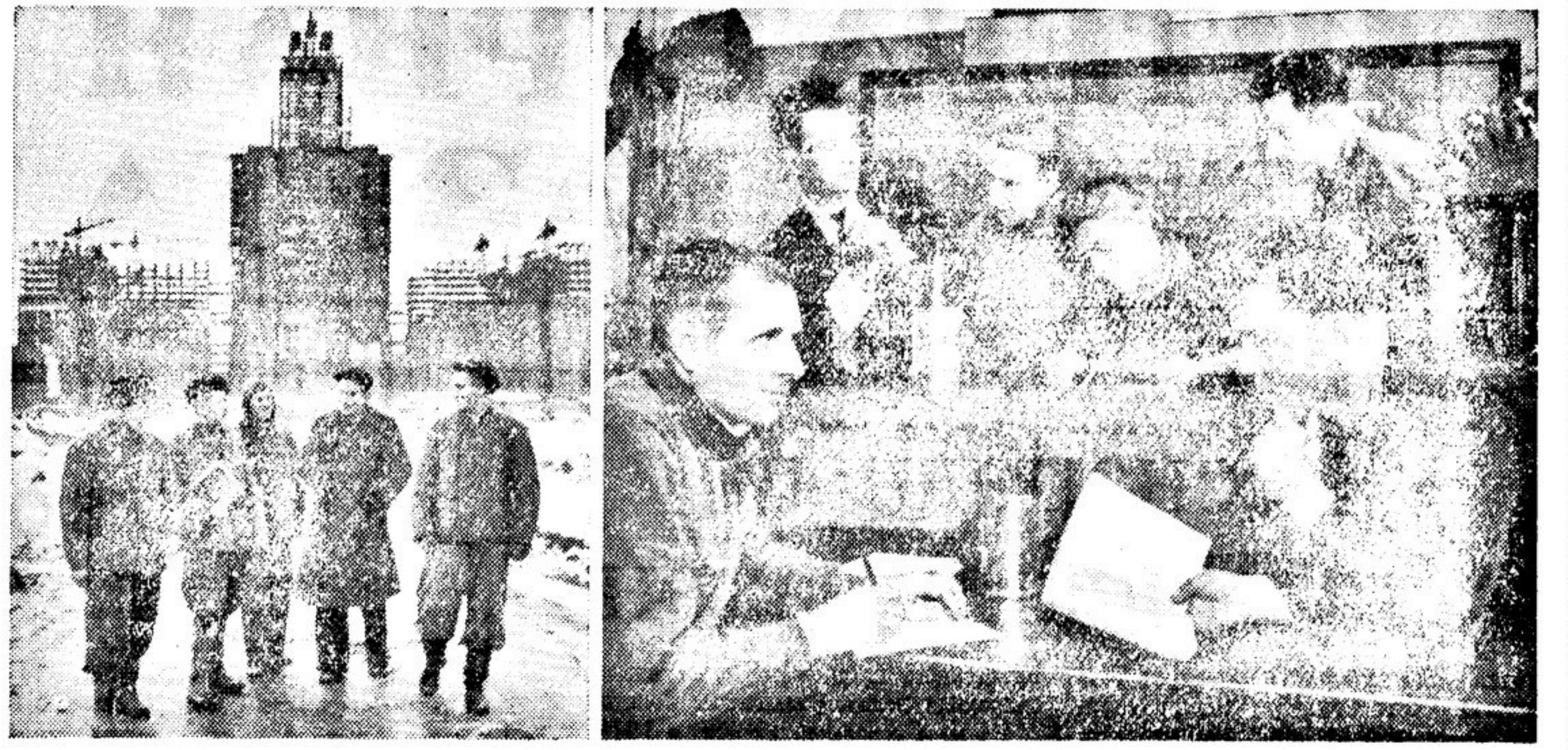
Строительство Московского университета на Ленинских горах.

Высоко в небо поднялось центральное здание. Заканчивается монтаж его башенной части, а на нижних этажах ведутся работы по внутренней отделке и облицовке фасада. Растут учебные и жилые корпуса. И чем отчетливее вырисовываются контуры этого грандиозного архитектурного ансамбля, тем вдохновеннее трудятся строители, воздвигаая для советской молодежи подлинный дворец науки.