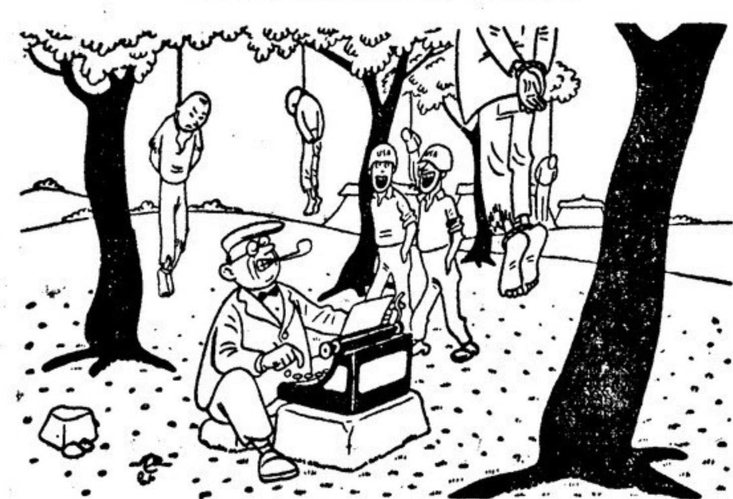
Американский корреспондент: «Наши храбрые ребята приучают местное население к американскому образу жизни...» (Рисунок художника Вердини из итальянского журнала «Виз нуова»)